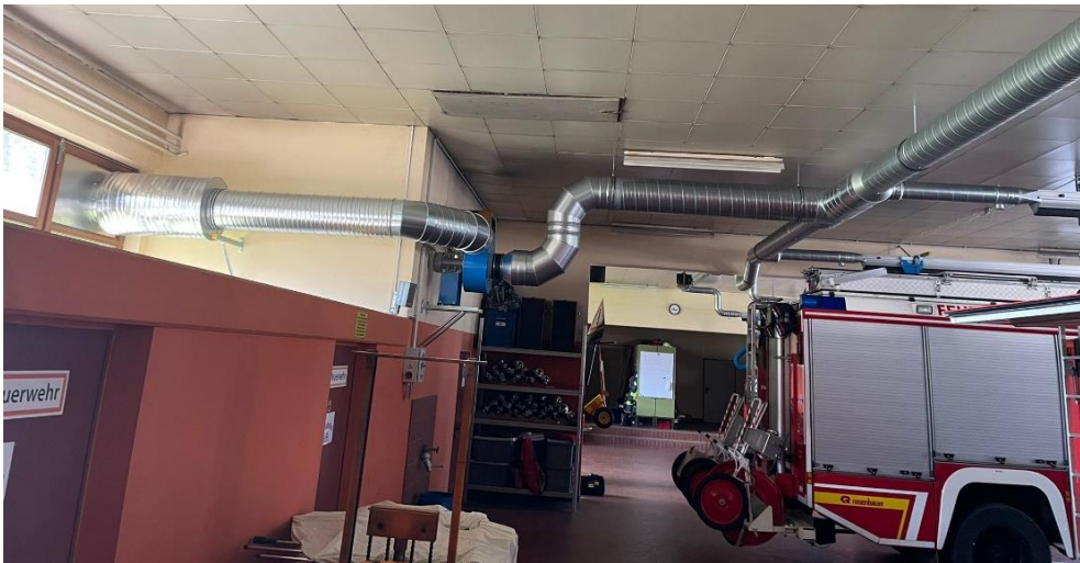
Bilder Feuerwehrgerätehaus Gersfeld Kernstadt, ausgeführt in 2023

Kernstadt und Gichenbach wurden mit Abgas-Absauganlagen bestückt, Rodenbach erhielt eine neue Umkleidekabine und das Gebäude in Schachen wurde entsprechend den Vorgaben erweitert und umgebaut. Die Kosten für Schachen betragen rd. € 700.000. Für das Feuerwehrgebäude in Hettenhausen befindet sich der Anbau eines Garagentracks in der Umsetzung. Die Gesamtkosten liegen hier bei rd. € 150.000.